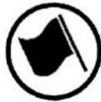
Regularity test start