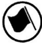
Regularity test start