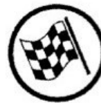
End of regularity test