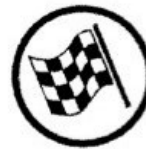
End of regularity test