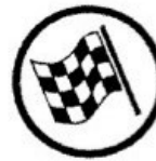
End of regularity test