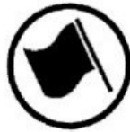
Regularity test start