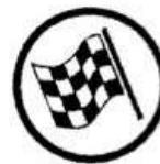
End of regularity test