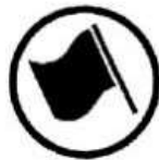
Regularity test start